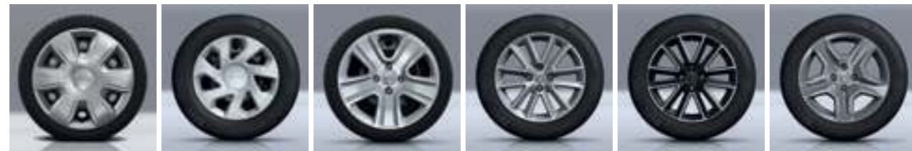
KRYTY KOL 15" TISA