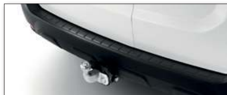
Tažné zařízení Standard vč. kabeláže