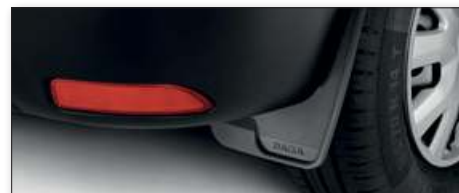
Přední a zadní zástěrky

V ceně vozu není zahrnuta povinná výbava.