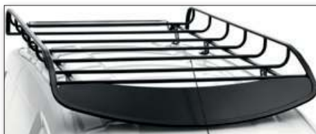
Střešní ocelová galerie